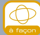
à façon Flasque spéciale découpe à façon