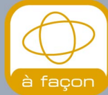
à façon Support spécial découpe à façon