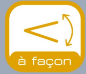
Patte spéciale pliée à l'inclinaison souhaitée de 0 à 30°