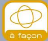
à façon Support mécano- soudé