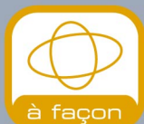
à façon Flasque spéciale découpe à façon