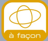
à façon Flasque spéciale découpe à façon