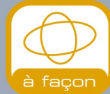
à façon Support mécano- soudé